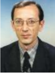
Muin SAYIT Makine Teknolojisi